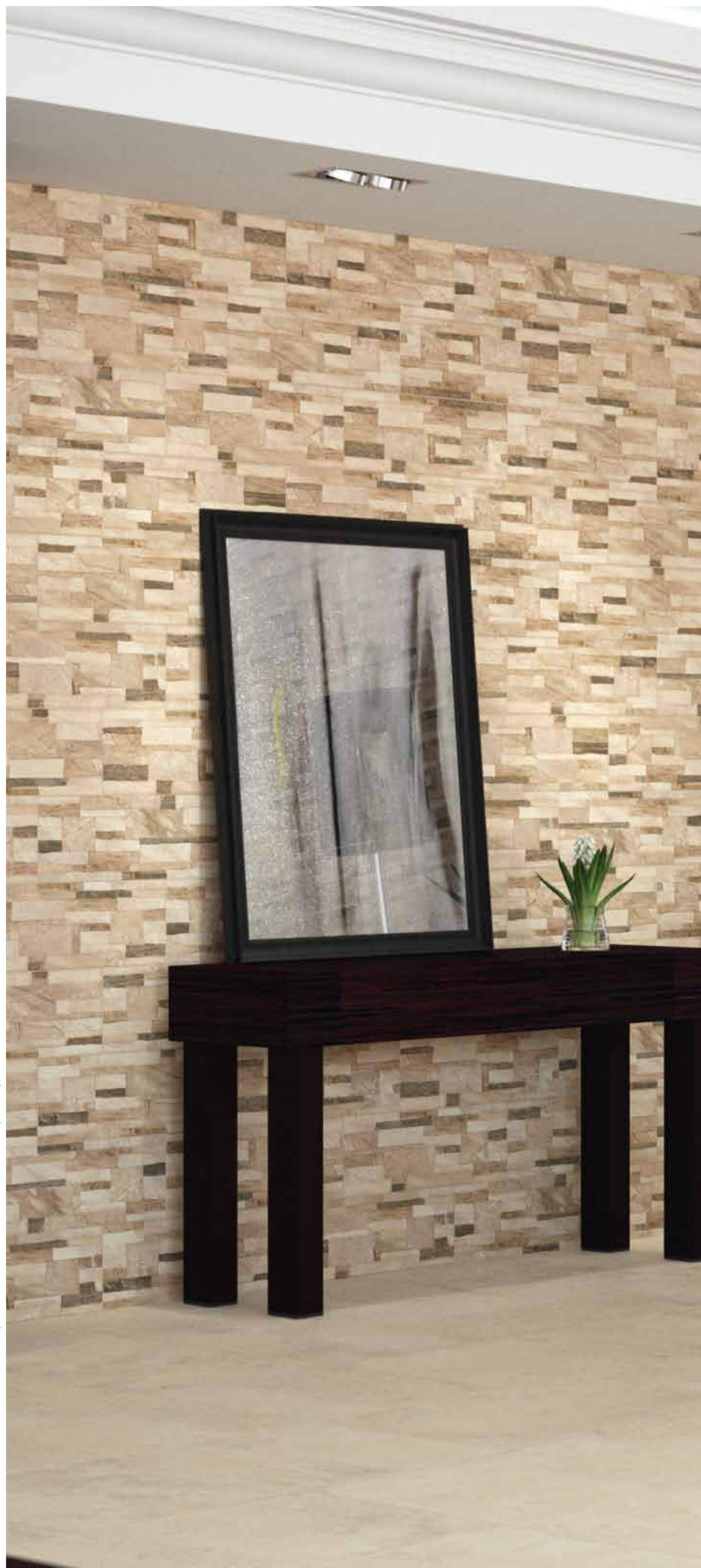
Ambiente realizado con Brick Lasha Sand 17,5 x 50 cm. Pavimento Aruba Bone 44,7 x 44,7 cm.