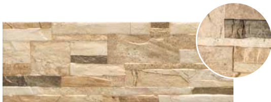
Brick Lasha Sand 17,5 x 50 cm.